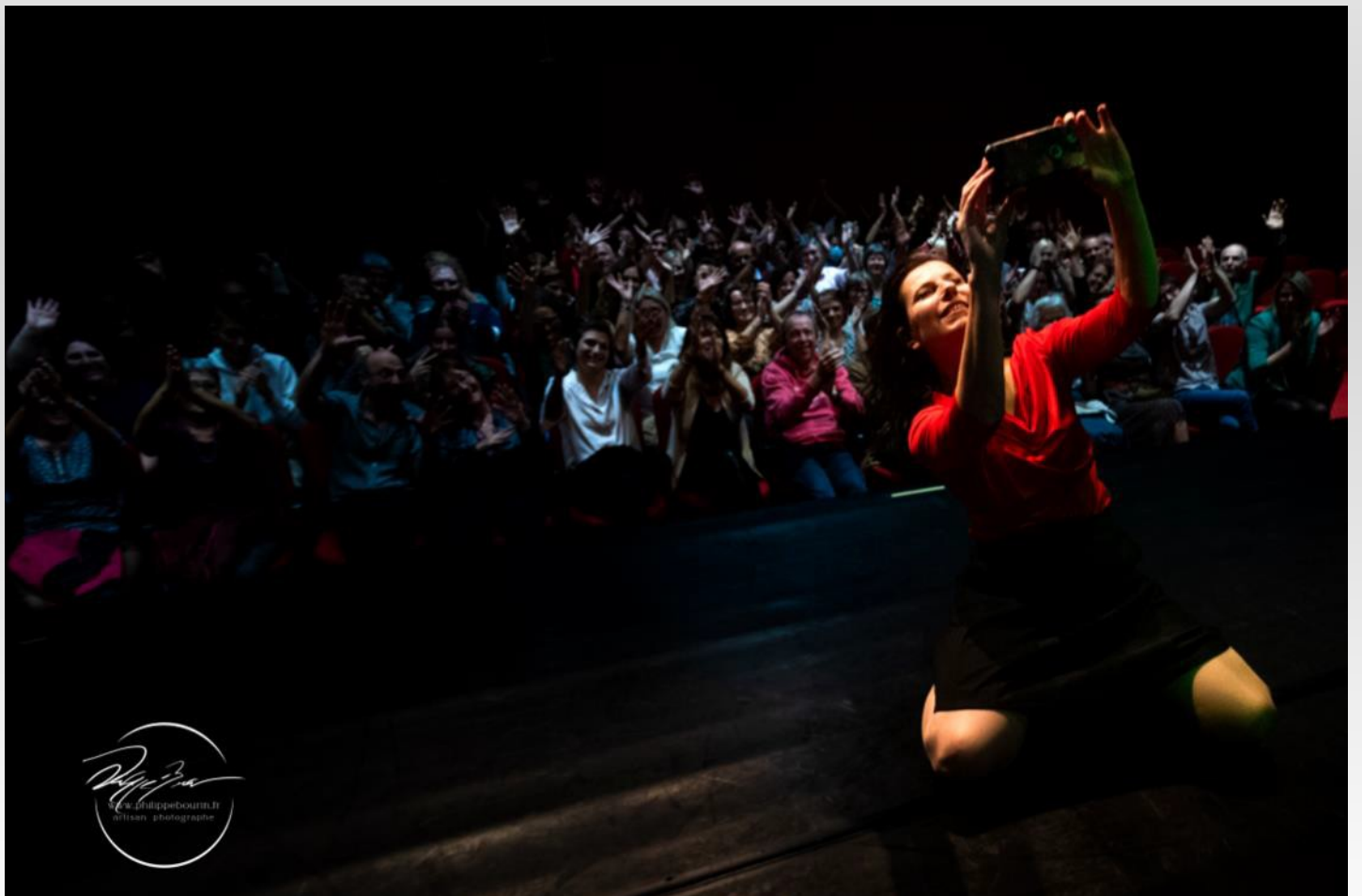
Moments de partage avec le public après la représentation